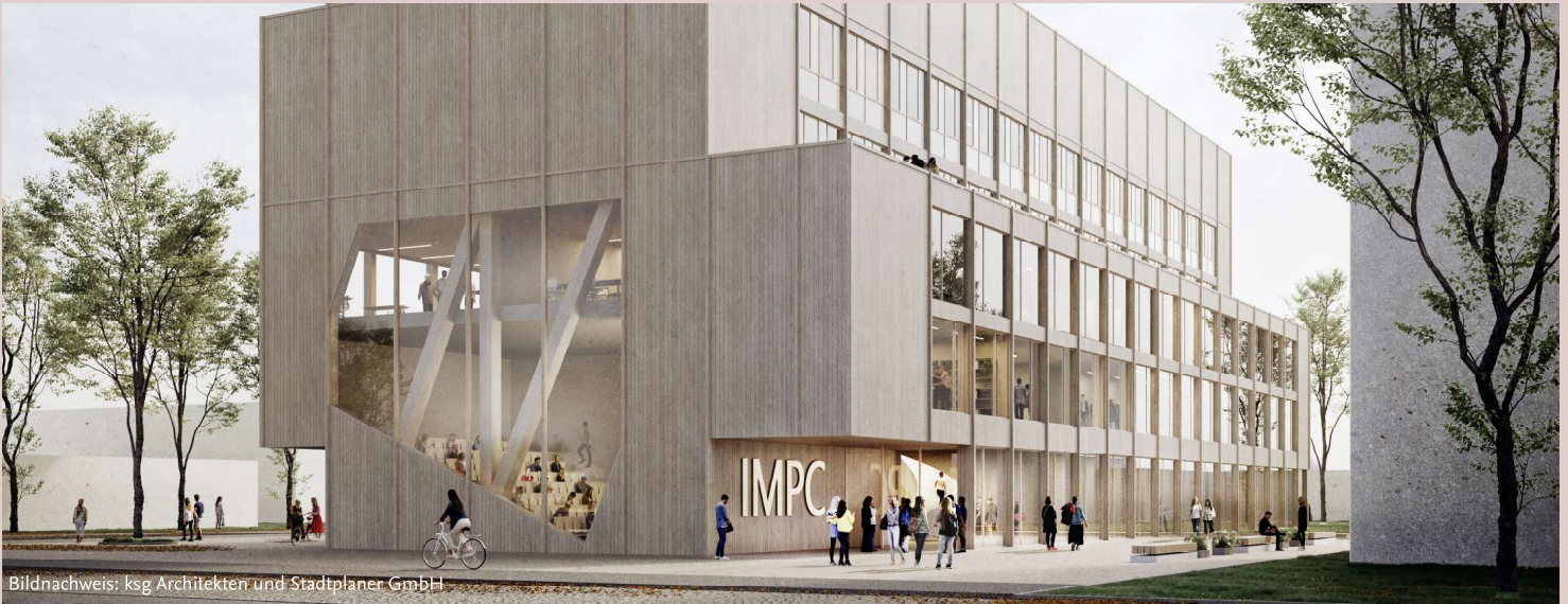
Bildnachweis: ksg Architekten und Stadtplaner GmbH