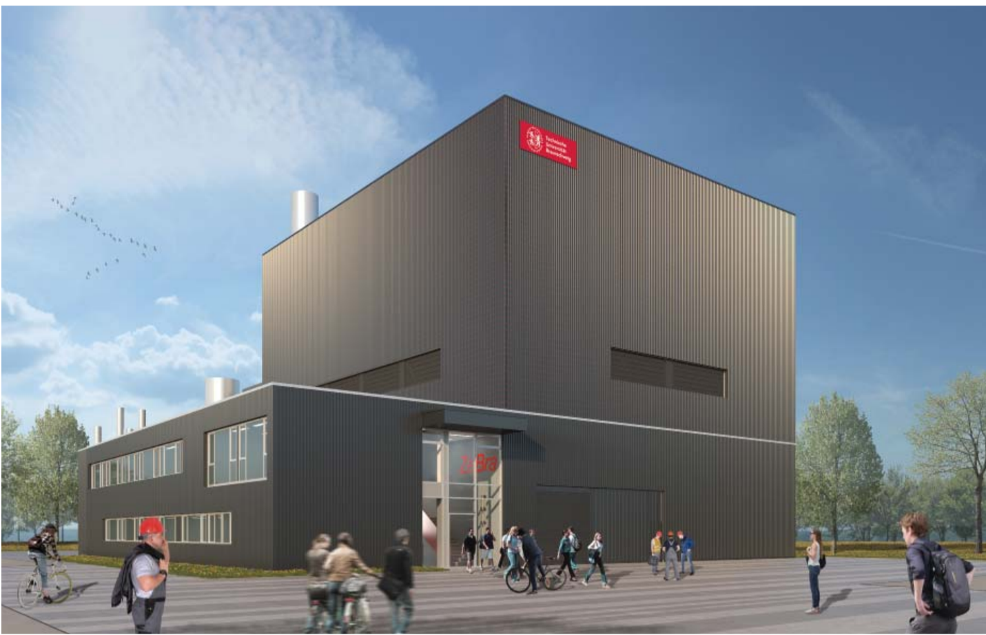
Entwurfsverfasser: pbr AG Visualisierung: 4-e-motions

Der Forschungsneubau besteht aus drei Gebäudeteilen: der Experimentierhalle, dem zweigeschossigen Messraum- und Bürotrakt und der Rauchgasreinigungsanlage (RGRA).