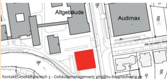
Kontakt Geschäftsbereich 3 - Gebäudemanagement: gbb@tu-braunschweig.de

Die Belüftung erfolgt über Kippoberlichter und vertikale Kippfenster und einem zentralen Oberlicht im Dach.