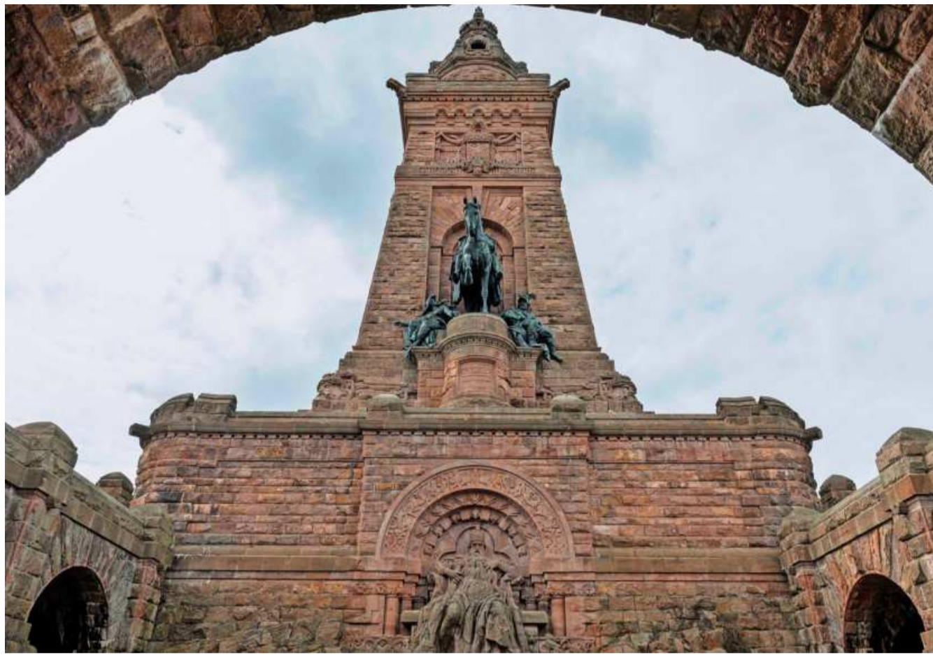
Wo Hindenburg nicht mehr steht, aber doch noch in der Nachbarschaft unter Glas aufgebahrt überdauern soll: Kaiser Wilhelm I. über Barbarossa am Kyffhäuser-Denkmal bei Bad Frankenhausen.

Auf dem Kaiserplatz vor dem Bahnhof von Wesel stand bis 1945 ein Denkmal Wilhelms I. Bürger der Stadt am Niederrhein hatten es 1906 bei dem Berliner Bildhauer Reinhold Begas in Auftrag gegeben, dessen Kaiser-Wilhelm-Nationaldenkmal wenige Jahre zuvor an der Berliner Schlossfreiheit enthüllt worden war. Auch das vor dem Reichstag errichtete Bismarck-Nationaldenkmal stammte von ihm. Mit Begas' überlebensgroßer Statue erreichte der wilhelminische Nationalmonumentalismus die niederrheinische Provinz. Knapp vier Jahrzehnte waren dem marmornen Imperator dort vergönnt. Am Ende des Zweiten Weltkriegs wurde das Denkmal gestürzt, aber nicht zerstört. Eingelagert überdauerte es die nächsten Jahrzehnte, bis unlängst eine neuerliche Spendenaktion das kaiserliche Monument wieder ans Licht holte. Nicht zurück auf den Kaiserplatz, der ohnehin seit 1970 – auch damals schon wurden Straßen umbenannt – den Namen des in Wesel geborenen CDU-Politikers und Bundesfinanzministers Franz Etzel trägt, vielmehr, nicht ganz so prominent, vor das Niederrheinmuseum, das bis vor Kurzem noch Preußen-Museum hieß. Dort freilich steht das Standbild nicht, sondern es liegt: auf einem neuen Sockel und in einem gläsernen Sarkophag. So ist es politisch gewollt. Niemand soll mehr zu