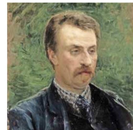
Juhani Aho, gemalt von Venny Soldan-Brofeldt. Foto Picture Alliance

Und je mehr man dem Gespräch der Studenten lauscht, umso stärker fühlt man sich an die große Aufbruchsstimmung nach dem Ende des Kalten Krieges und den trügerischen Glauben an das baldige „Ende der Geschichte“ erinnert. An den drohenden Zusammenbruch dieser Träume heute draußen im weltweiten Wirrwarr.