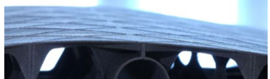
Abbildung 1: Fadenbildung in automatisch versteifter Struktur (oben) und Schematisches Vorgehen bei im Vasemode versteiften Strukturen (unten)