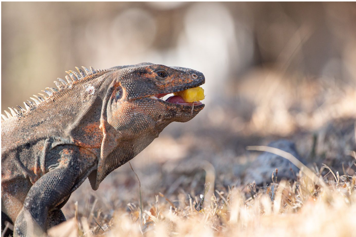
Abbildung: Leguan Stratzlawski, Matthias Beyer/Team ISONDRONES/TU Braunschweig, Januar 2023