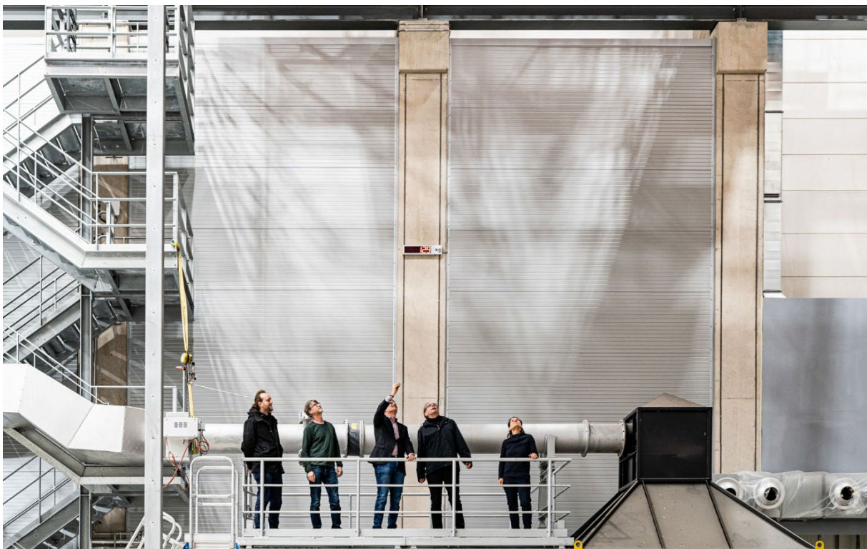
Abbildung: Baustelle ZeBra, Maddie Franke/TU Braunschweig, März 2023