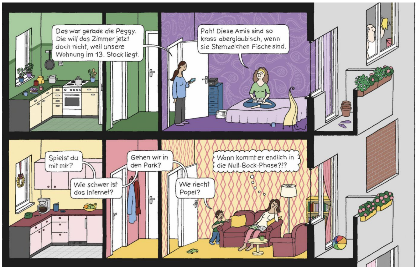
Abbildung 2: www.avant-verlag.de/comics/das-hochhaus/