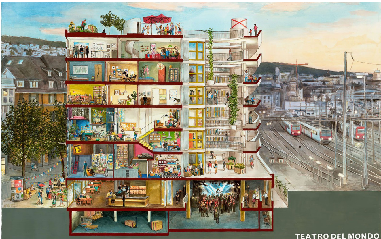
Abbildung 3: www.emi-architekten.ch/projekte/zollhaus/

Zeigen Sie, was in diesem Haus gleichzeitig geschieht: Wer lebt oder arbeitet dort? Welche Räume gibt es? Welche kleinen Szenen, Begegnungen, Routinen, Konflikte oder Überraschungen spielen sich ab? Wie verbindet sich das Gebäude mit der Straße, dem Hof, dem Garten, dem Dach oder der Nachbarschaft?