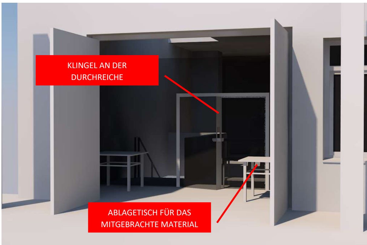
Abbildung 2- ABHOLTISCH

Bei Fragen oder Unklarheiten schreibt mir ruhig m.frass@tu-braunschweig.de