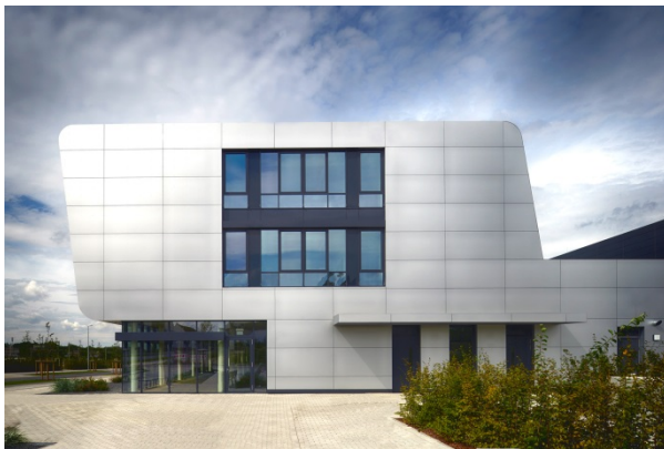
Abbildung 1 & 2 Der NFF-Neubau am Forschungsflughafen

Für ihren Entwurf des Neubaus des Niedersächsischen Forschungszentrums Fahrzeugtechnik (NFF) ein Zentrum der Technischen Universität Braunschweig wird die pbr Planungsbüro Rohling AG aus Osnabrück mit dem internationalen Architektur- und Designpreis „Iconic Award“ in der Kategorie „architecture public“ ausgezeichnet. Die Preisverleihung findet am 5. Oktober 2015 in der Pinakothek der Moderne anlässlich der Gewerbe- und Immobilienmesse Expo Real in München statt.