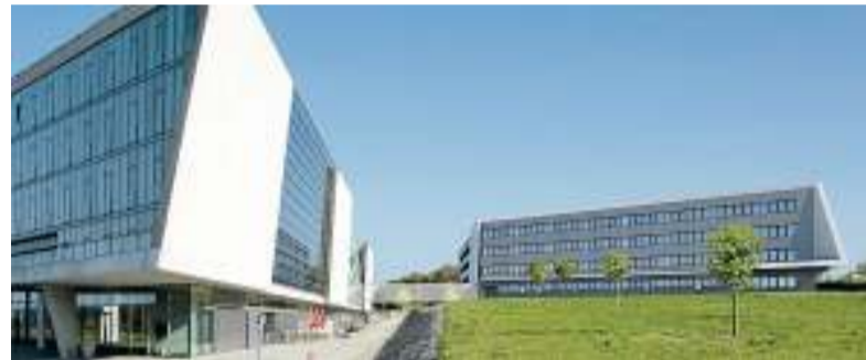
So wird die Open-Hybrid-Lab-Factory (hinten) aussehen. Sie entsteht direkt neben der Auto-Uni (links).